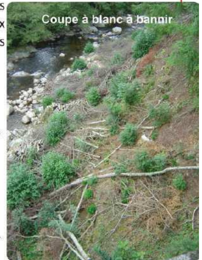
Coupe à blanc à bannir