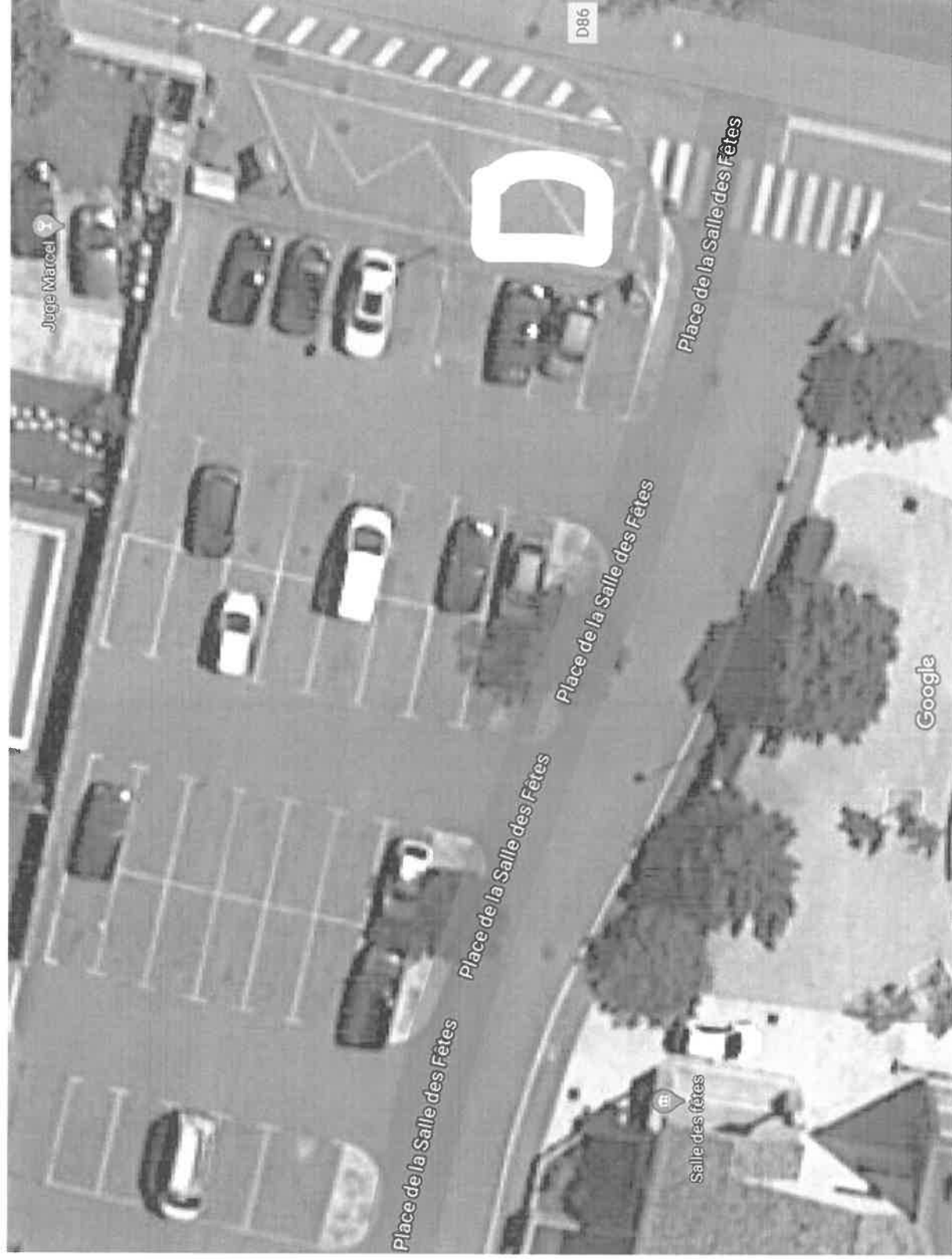
Carré blanc : zone de stationnement Foodtruck